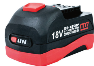
DB-1850P akumulátor 5,0 Ah