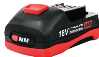
DB-1825 akumulátor 2,5 Ah

4 LED-indikátory pro zobrazení stavu nabíjení