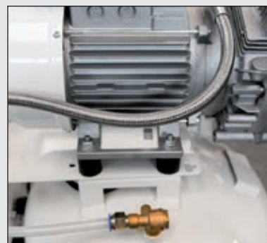
Pryžové podstavce pro snížení přenosu vibrací z kompresoru