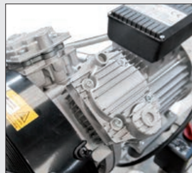
Silný bezolejový kompresor se 2 písty