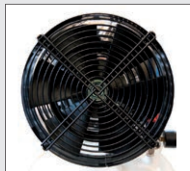
Přidaný ventilátor pro účinné chlazení kompresorové jednotky